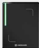
Line Ultra Prox