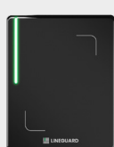
Line Ultra Prox